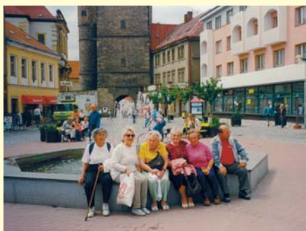
Z výletu do Jičína

Zájem je tak velký, že většinou hned v lednu, když zveřejníme nabídku, je z 90 % obsazeno. Letos jedeme na týden na Slovensko do termálních koupelí, na rekondiční pobyt do Poděbrad, potom do Štikova u Nové Paky - tam to bude zaměřeno na přednášky, rehabilitaci a cvičení a do Mariánské v Krušných Horách - procházky přírodou, testy, přednášky. Ceny zájezdů jsou velmi přijatelné - například týden v Poděbradech vyjde asi na 2000 Kč. Díky sponzorům se nám daří ceny držet na poměrně nízké úrovni - ale není vždycky jednoduché peníze sehnat, to mi věřte. Pokud jde o vozíčkáře, ti nemohou jezdit na všechny zá-