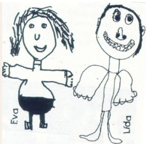
Takhle vidí děti z mateřinky na Lehovci své paní učitelky.