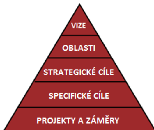
Obr. 1: Struktura strategického plánu