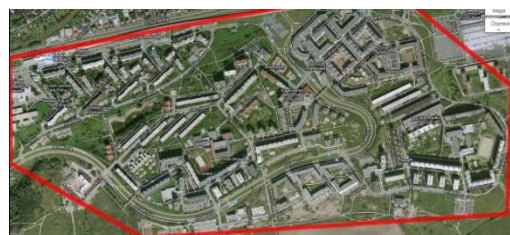
8 Černý Most