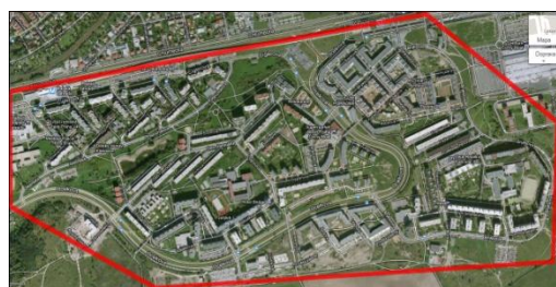
8 Černý Most