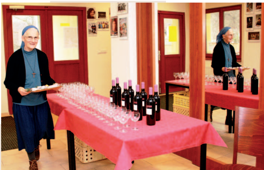
Seniory čekala v Kyjích mimo jiné i ochutnávka kvalitních vín.