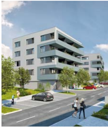
Vizualizace: Landia Management, s. r. o.

O úspěchu svědčí také to, že vyprodáno bylo všech pět desítek stavebních pozemků i 18 řadových domů v 1. fázi. Aktuálně mohou zájemci vybrat z dvaadvaceti rodinných řadových domů ve 2. fázi a 48 krásných bytů 1+kk až 4+kk s přímým výhledem na novou čtvrť a zeleň nad meandry Rokytky. V této části Prahy patří Rajský vrch nesporně k nejlepším lokalitám. Jak obyvatelé Prahy 14 dobře vědí a oceňují, je odsud blízko za sportem, do přírody, za službami či školami směrem Černý Most i veřejnou (metro Rajska zahrada 5 minut pěšky) nebo individuální dopravou do centra Prahy.