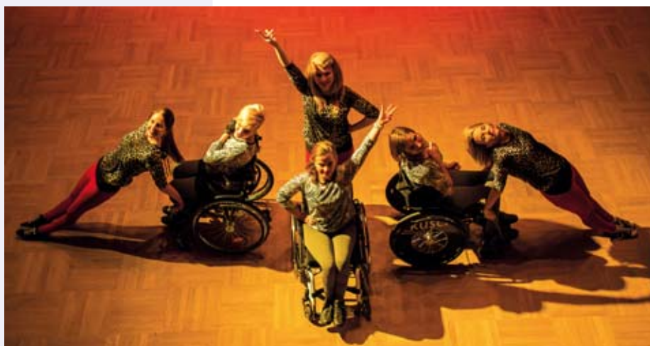
Taneční choreografie SKV Praha na plese v Kralupech nad Vltavou.