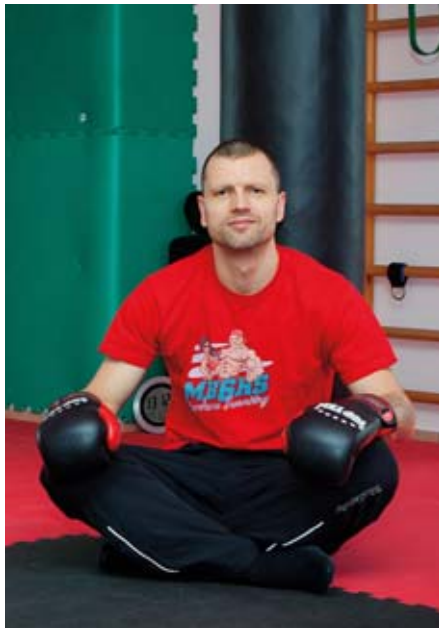
V rámci tréninku si v MB Gym na Hutích můžete užít i box nebo cyklistický trenážer.

Obrovský rozdíl je vidět v podstatě všude v zahraničí, já osobně s tím mám zkušenost třeba z Finska, kde jsem nějaký čas působil. Tam je na-