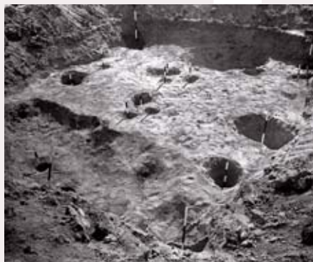
Fotografie jedné z takzvaných polozemních chat částečně zahloubených do podloží. Výzkum v Hloubětíně proběhl v letech 1952–1953.

Stavby byly podle archeologických nálezů různé konstrukce. Souběžně s vnější palisádou se našly stopy po 13 povrchových chalupách. Ty byly vystavěné z kúlů kratší stranou ke hradbě a delší strany pak tvořily jakousi ulici směrem k návsi. Délka stěn přitom byla asi 3 až 6 metrů. Za bránou vnitřní hradby pak byly ve volném prostoru nalezeny pozůstatky několika dalších, tentokrát zahloubených stavení, která byla zřejmě zakryta sedlovými střechami založenými stanovitě přímo od země. Dalším odhaleným typem konstrukce pak byly kuželovité přístřešky nesené středovým kulem.