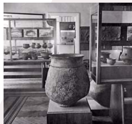
Pohled do archeologické expozice na Hanspaulce, otevřené v červenci 1955.

Objevena byla také stavba, která podle archeologů sloužila jako dílna, v níž se vyráběly kuželovité předměty, podle archeologů nejspíše hliněná závaží ke tkalcovským stavům. Zde jich bylo v různém stadiu vypalení nalezeno hned 60. Dalším překvapivím byly nalezené zbytky limonitických slepenců, pískovce a železná struska. Ty dokazovaly, že se zde vyrábělo železo. Ačkoliv nikde nebyla nalezena pec, a tudíž není známa její konstrukce, rozbořem bylo zjištěno, že teplota v redukčních pecích musela dosahovat až 1 300 °C, které mohlo být dosaženo jedině za pomoci dmychadla.