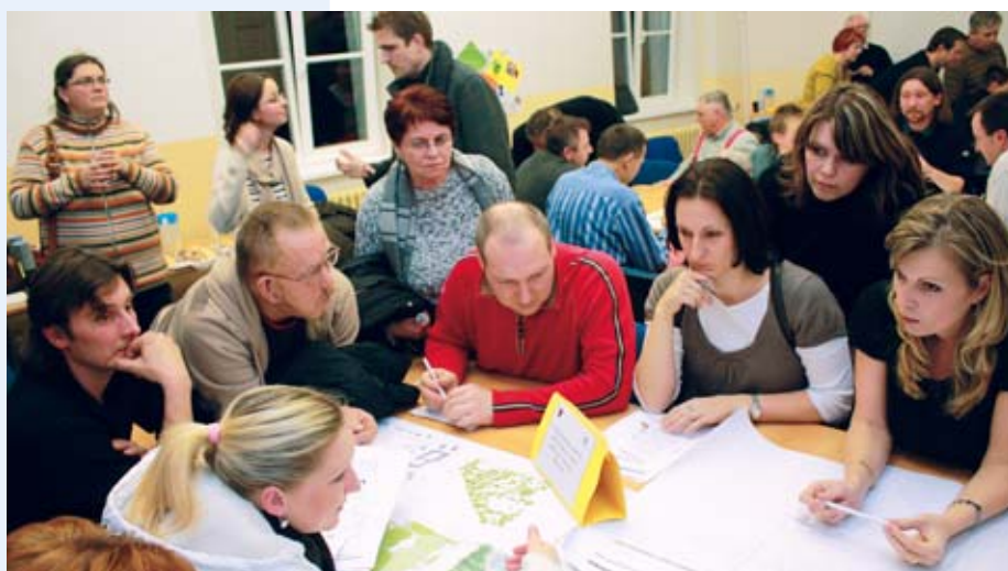
Situaci kolem proměny parku v Pílské ulici v Hostavicích řešili zástupci Prahy 14 s občany od počátku. Na snímku je jedno z prvních veřejných jednání této záležitosti z roku 2011.

Během první etapy, která by měla skončit spolu s letošními letními prázdninami, je naplánováno vybudování kompletní cestní sítě, osazení parku lavičkami, cyklostojany a odpadkovými koši, zavedení odpovídajících