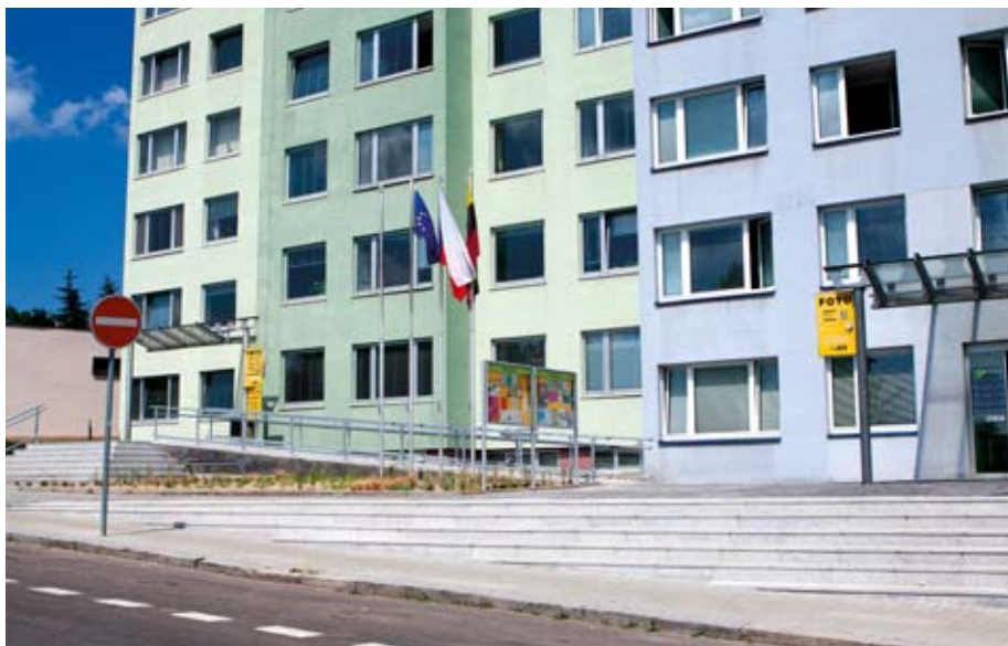
Příkladem v odstraňování bariér jde i samotná radnice. Zatímco dříve museli vozíčkáři cestu mezi dvěma budovami úřadu objíždět, dnes ji spojuje moderní rampa (na snímku).

Třetí fáze mapování bariér v Praze 14, do níž spadá oblast sídliště Lehovce a Hloubětín, zabrala období od května do července roku 2011. Očekávání, že starší zástavba Hloubětína „nabídne“ více bariér než mladší sídliště na Černém Mostě, se potvrdilo. V případě Lehovce byl nejčastěji zaznamenávaným problémem velmi nerovný či poškozený povrch chodníků, bariérové přechody či logicky nenařazené bezbariérové úseky. Zcela zásadní je zde podle Centra Slunečnice vyřešení propojení z Lehovce k Rajske zahradě přes Cíglerovu ulici, problematická je pro vozíčkáře i nevidomé také dostupnost MHD v této lokalitě. Příkladem nesmyslné práce je i bezbariérová úprava nových zastávek tramvaje v Hloubětíně, kde bezbariérové úpravy a navigace pro nevidomé nenavazují dále. Vyřešit se naopak podařilo nebezpečný přechod přes Poděbradskou ulici u Hloubětínské. Přes