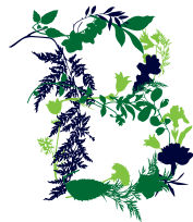
Botanická zahrada Praha