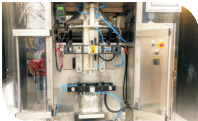
Balící linka pitné vody v sáčcích