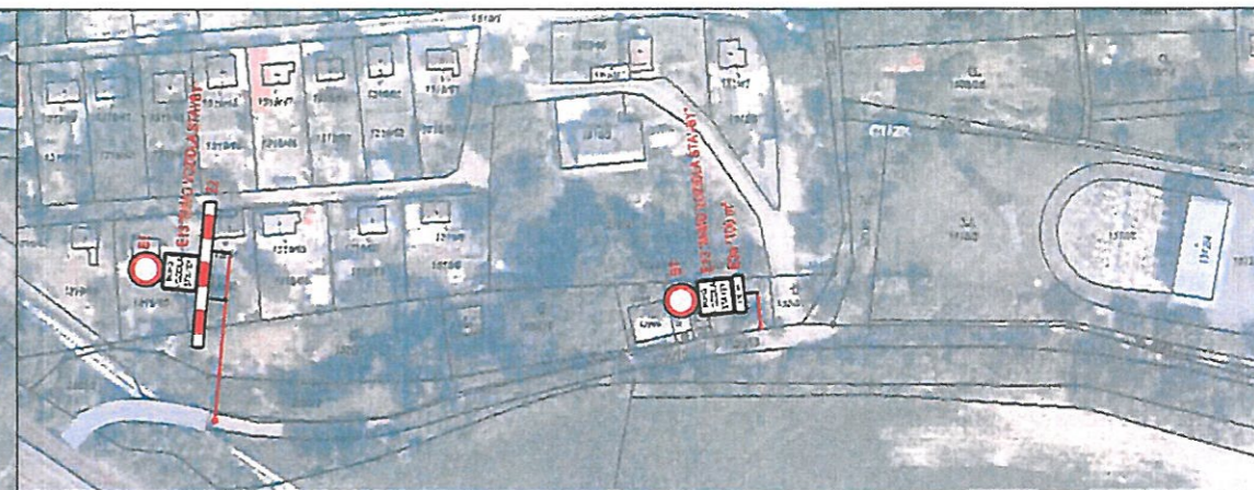
K Hutím - detail č. 3