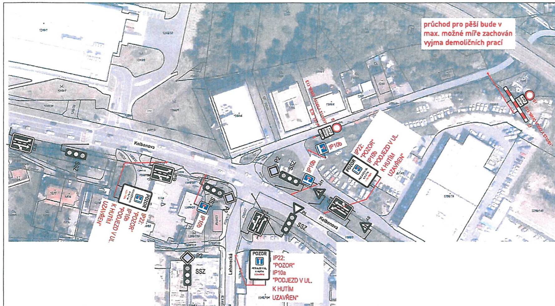
K Hutím - detail č. 1