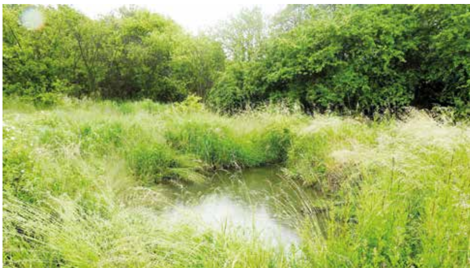
Mokřad v areálu společnosti Coca-Cola

Pokud byste se chtěli do mokřadu podívat, je to možné, ale jen v řízeném módu ve vedených skupinkách. Vhodné jsou prohlídky i pro studenty základních a středních škol. Výhodou je, že oproti běžným prohlídkám závodu sem mohou