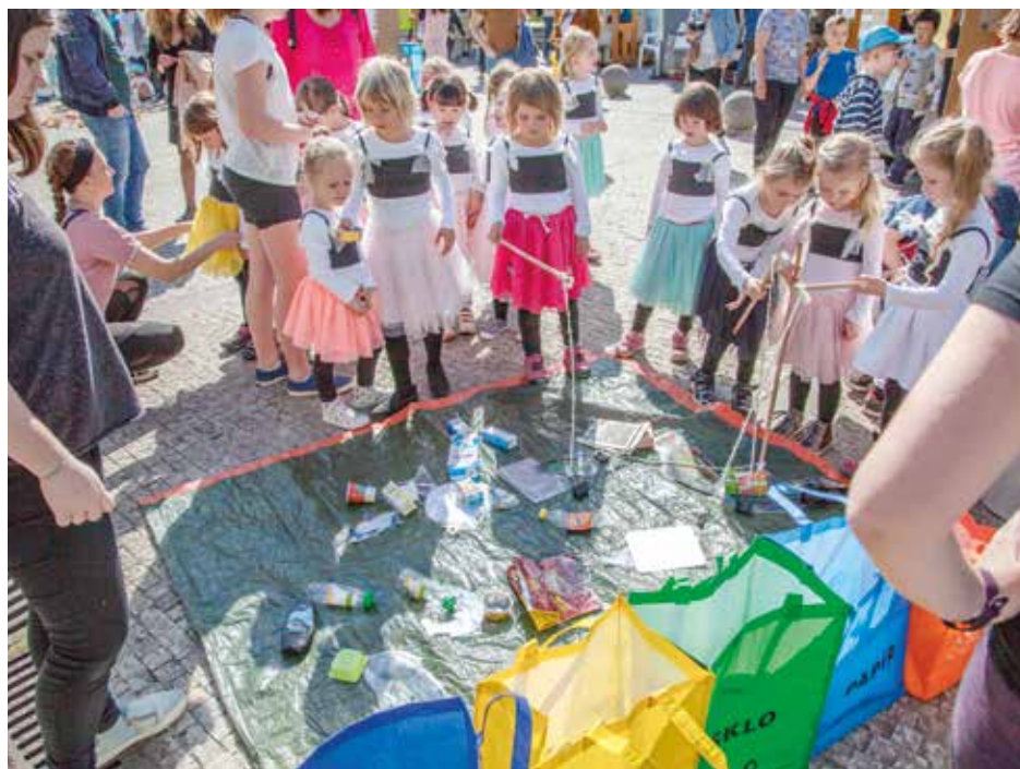
Městská část podporuje environmentální výchovu i u těch nejmladších

Že si lépe pamatujeme zážitek než stránku z učebnice, je známý fakt. Žáci ZŠ Vybíralova navštěvují každý rok představení v rámci projektu Jeden svět nestačí, loni viděli film věnovaný záchraně slonů v Thajsku. V rámci environmentální výchovy jezdí škola na exkurze do Toulcova dvora, pro druhý stu-