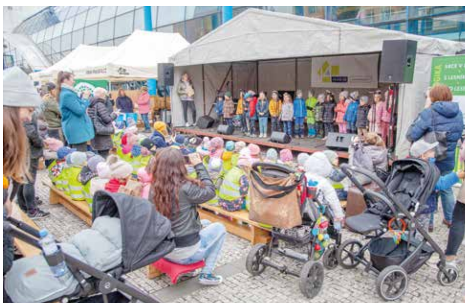
Na Den Země připraví Praha 14 vždy bohatý program

VÍTE, ŽE Z CELKOVÉHO OBJEMU VODY NA PLANETĚ TVOŘÍ PITNÁ SOTVA JEDNO PROCENTO? ŽE KAŽDOU MINUTU UBÝVÁ LESŮ O ROZLOZE DESETI FOTBALOVÝCH HŘIŠŤ? NEBO ŽE TĚMĚŘ POLOVINA ŽIVOČIŠNÝCH DRUHŮ ZAŽÍVÁ VÝRAZNÝ POKLES POPULACE? NEJEN Z TĚCHTO DŮVODŮ V POSLEDNÍCH LETECH SILNĚ REZONUJÍ TÉMATA JAKO OCHRANA KLIMATU, PODPORA BIODIVERZITY, HOSPODÁRNÉ NAKLÁDÁNÍ S VODNÍMI ZDROJI ČI UDRŽITELNÝ ROZVOJ. TAKÉ ČTRNÁCTKA PATŘÍ MEZI PRAŽSKÉ MĚSTSKÉ ČÁSTI, KTERÉ EKOLOGICKÉ PRINCIPY DLOUHODOBĚ PROLÍNÁJÍ DO ŘADY SVÝCH STRATEGICKÝCH DOKUMENTŮ, INVESTIČNÍCH PROJEKTŮ I AKTIVIT PRO VEŘEJNOST.