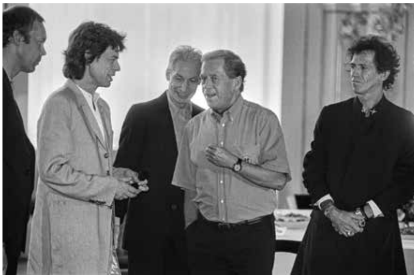
Václav Havel s Rolling Stones