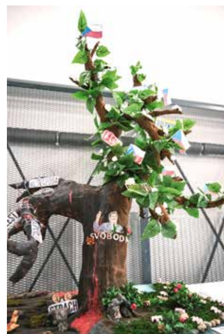
Vítězný 3D model

a 7. B Základní školy Vybíralova. „Děti kromě hodin výtvarné výchovy pracovaly i ve výtvarném kroužku, na který přicházely o půl hodiny dříve a odcházely o půl hodiny déle, zjevně je to bavilo. Vyzkoušely si práci s různými materiály – dřevem, papírmáše a dráty, kterými musely model vyztužit, byla to tak trochu i lekce statiky. Já jsem jen pomáhala, nápad je jejich,“ uvedla Petra Pražská ze ZŠ Vybíralova, která vedla vítězný tým. Druhou příčku obsadil model žáků 8. A ZŠ Bratří Venclíků s názvem Hlasy, které dostaly křídla, bronzovou medaili si odnesl tým devátáků (9. A a 9. B) ze ZŠ Šimanovská. Bodovali s modelem Cesta ke svobodě a demokracii. Vítězná týmy se mohou těšit na odměny od městské části Praha 14. Všem autorům děkujeme za krásná a inspirativní díla a vítězům gratulujeme!