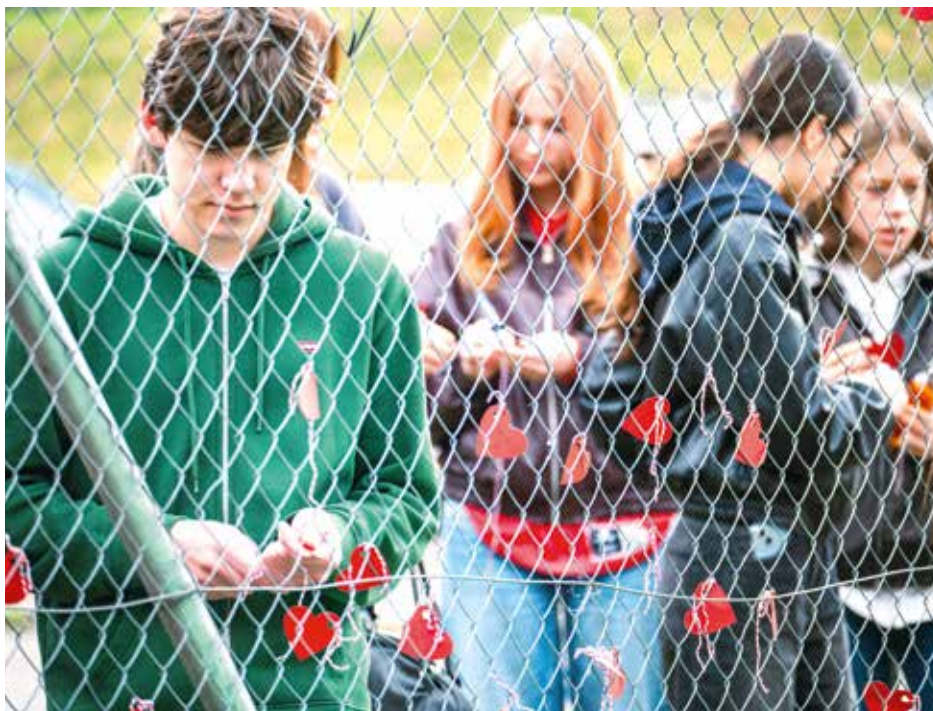
Děti u plotu vzkazů