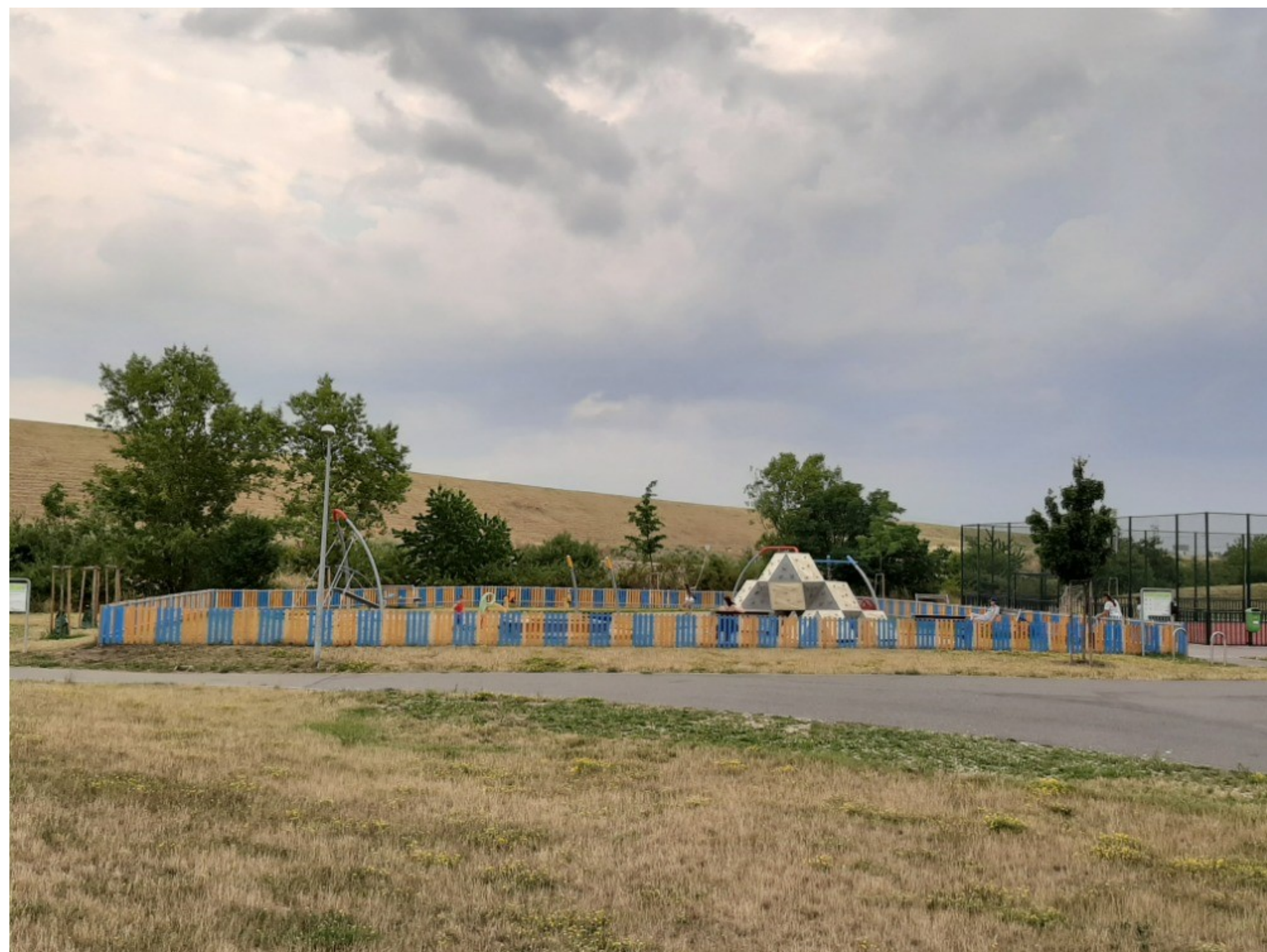
DĚTSKÉ HŘIŠTĚ U WORKOUTU (JAHODNICE)